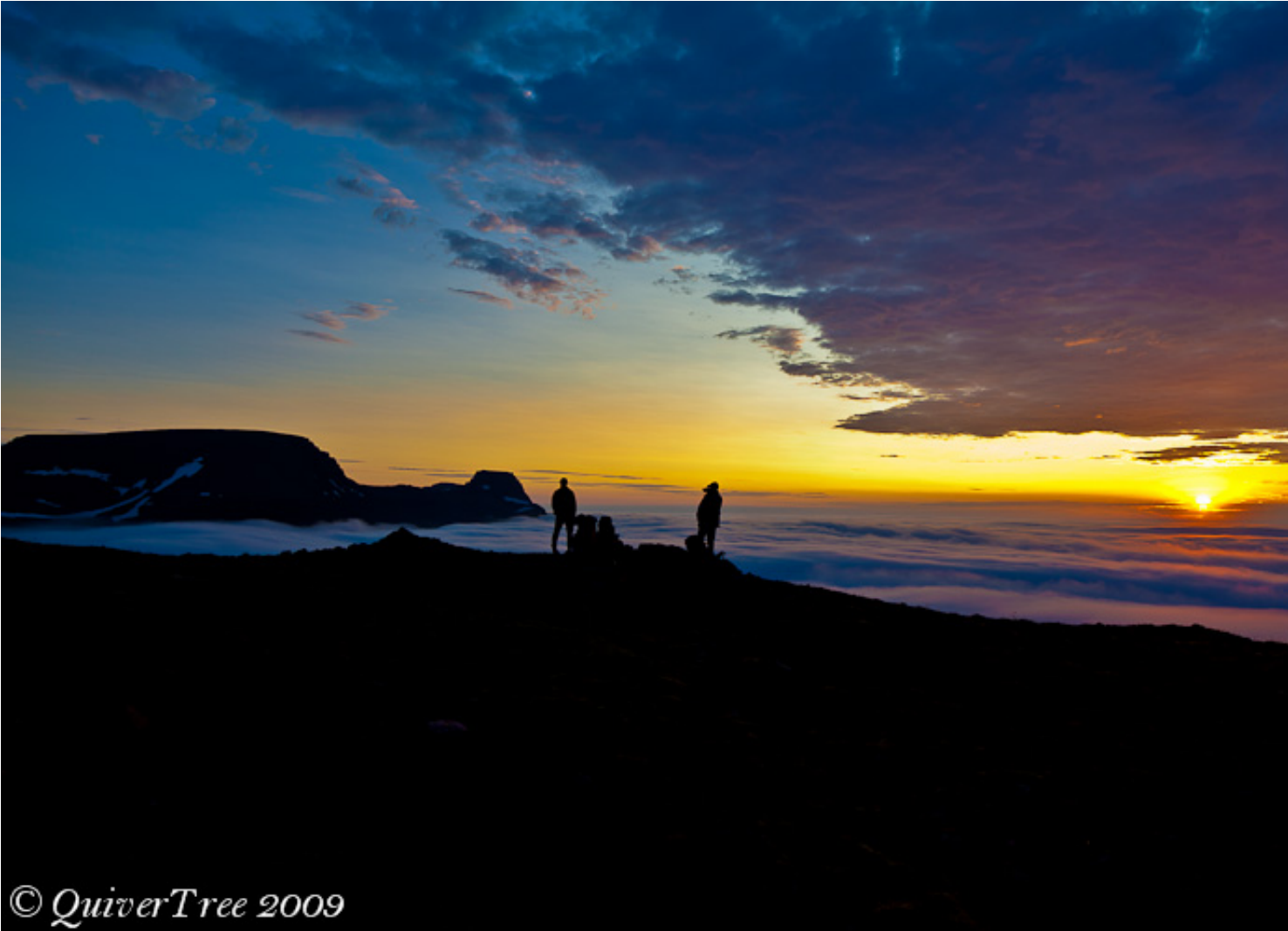
Über den Wolken: Sonnenuntergang am Pass Almenningaskarö